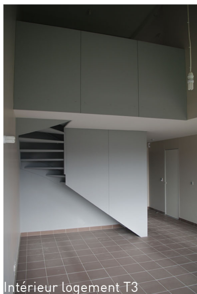
Intérieur logement T3