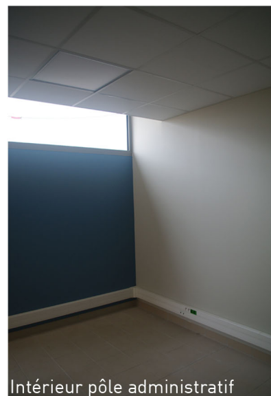
Intérieur pôle administratif